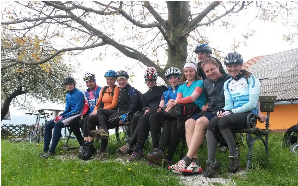
TK odsek PD Slivnica pri Celju na klopci na Colu

V naši bližini sta tudi dve kontrolni točki, na Kozjanski domačiji in Resevni, kjer si lahko odtisnete žig v Dnevnik STKP. Le-tega lahko sedaj kupite v Planinski založbi PZS v Ljubljani ali prek spleta. S pričetkom nove kolesarske sezone pa bodo na voljo tudi v Planinskem domu Resevna.