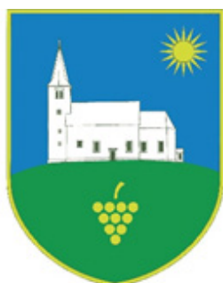
Krajevna skupnost Dramlje