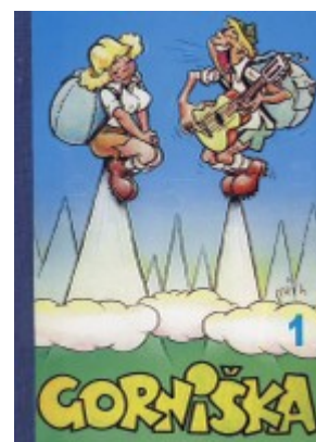
Pesmarica, ki je izšla pod okriljem Mladinske komisije

Ne dvomimo, da boste tekmovalci zmogli izziv državnega tekmovanja. Pa vendar vemo, da vas zagotovo zanima tudi, kje se skrivajo odgovori na vprašanja. So zapisani v teh vrsticah? Nekateri morda. Vsi ostali pa so skriti v besedilih pesmi, ki jih najdete na spletni strani www.planinske-pesmi.si . Želimo vam prijetno poslušanje!