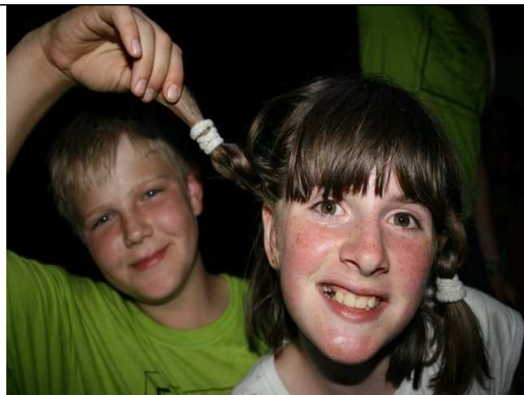
Zmagovalna Kekec in Mojca: Aljaž in Zala

Kekci in Mojce so se pomerili v različnih disciplinah: pletenje kitk, metanje čevljev, nabiranje rožic, iskanje raznih predmetov, izdelava pastirske palice, petje. Skratka, morali so pokazati številne spretnosti.