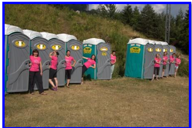
Nežnejši spol vodstva je bil letos v roza barvi.