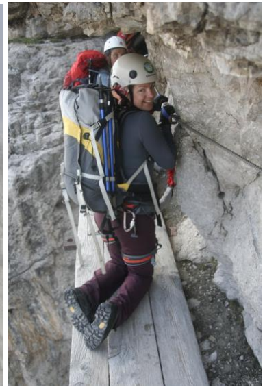
Police, ki jih ne zmanjka